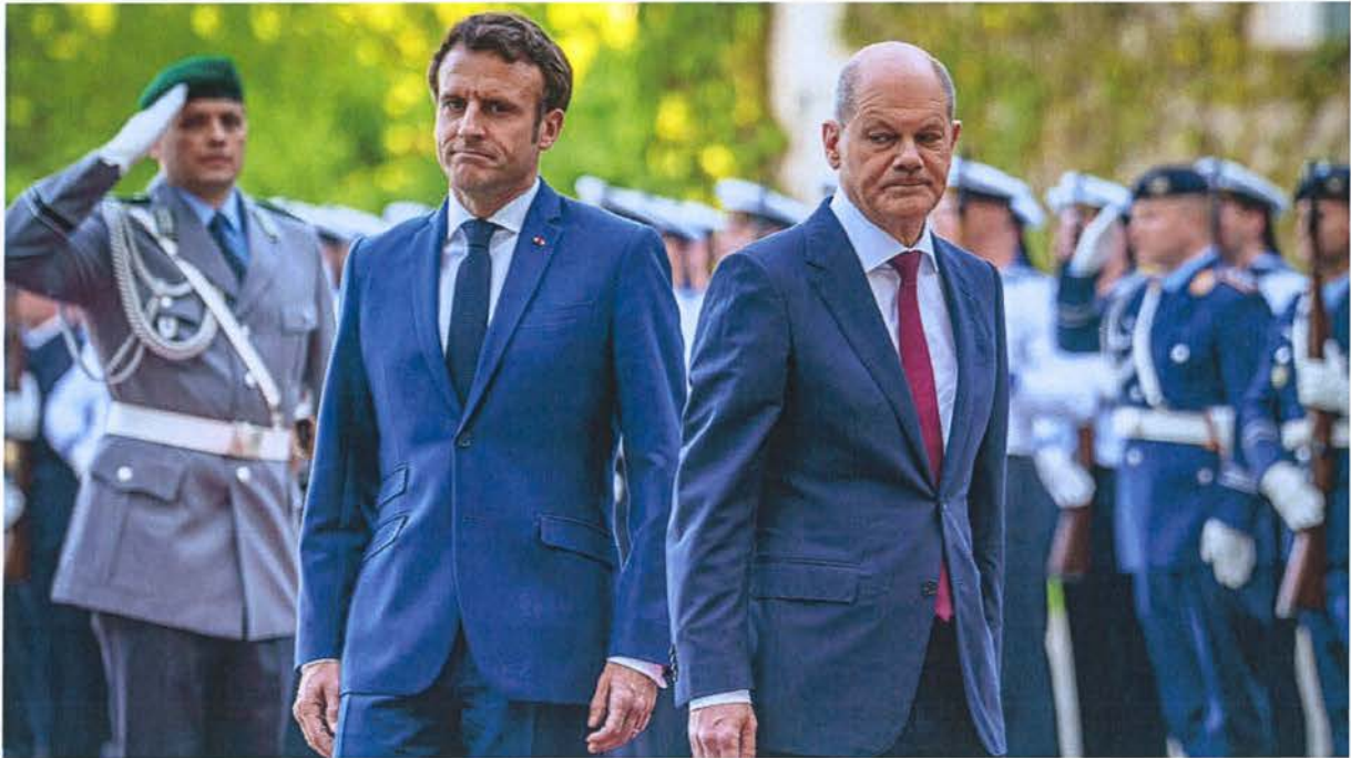
Abbildung 1