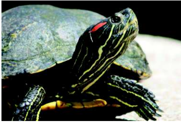
Tortue de Floride

Une espèce invasive (aussi appelée espèce envahissante) est une espèce soit végétale soit animale introduite, dans un nouveau milieu, volontairement ou non par l'humain et qui devient nuisible pour les espèces locales. Elle est originaire d'un pays étranger et menace la biodiversité locale et l'environnement là où elle s'est implantée.