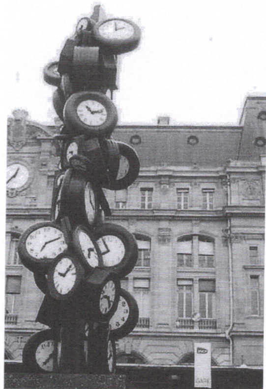
Lefèvre Daniel, L'horloge de la gare Saint-Lazare , 2011.