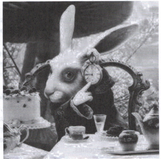
Lewis Carroll, Le lapin d'Alice au pays des merveilles (1869), Disney, 2010.

On constate, en effet, que de plus en plus de femmes situation remet toujours plus en question (bien qu'elle ne annelle du travail au niveau du ménage, de la vie styles de vie, le nombre croissant de célibataires, de etc. diminuent constamment « la capacité à résoudre les ndaires traditionnels (comme la famille, les quartiers, on du rôle des services publics proposés par l'état, au , ainsi que la nécessité de moderniser et de restreindre une importance cruciale. De nouveaux efforts sont faits en nes de qualité et orienter le travail du secteur public vers ent souvent de nouvelles formes de participation et de